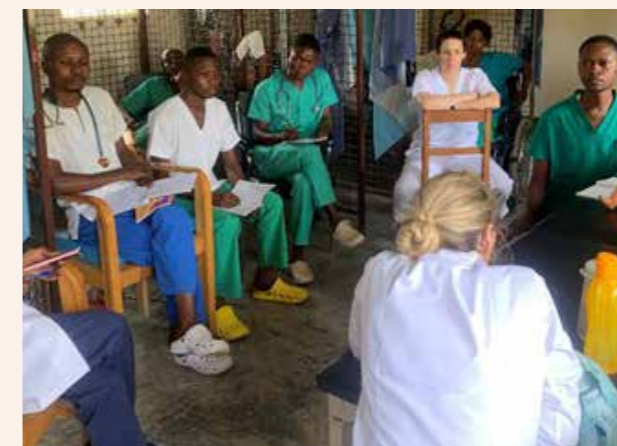
Kiné respiratoire : cours théorique.