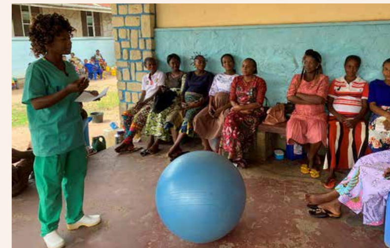
Formation lors d'un cours prénatal.