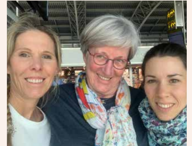
Les bénévoles pour la formation Kiné au départ.

La mission a débuté avec un service de kinésithérapie autonome qui assurait une moyenne de 30 à 60 nouveaux patients par mois avec deux kinés motivés et heureux de nous retrouver.