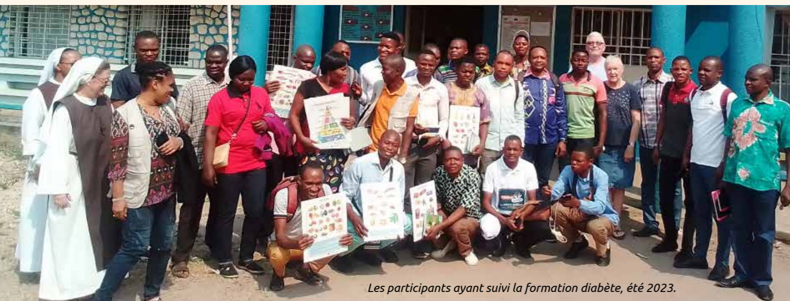
Les participants ayant suivi la formation diabète, été 2023.