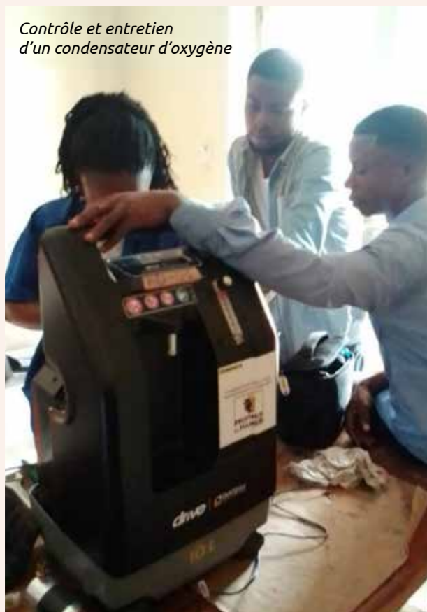
Contrôle et entretien d'un condensateur d'oxygène